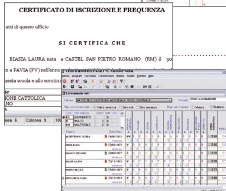
Certificato di iscrizione e frequenza